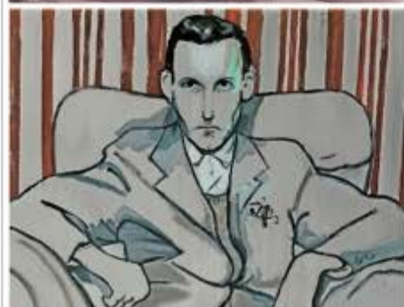
● The Homecoming , Grey, 2013, 60 x 80 cm.