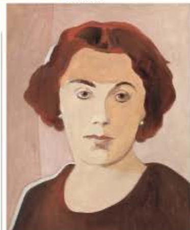
● Rachet W. , 2009, 50 x 40 cm.

De ogen die in de andere portretten zo nadrukkelijk aanwezig zijn, ontbreken hier: het is gezichtsvrij, de titel van de tentoonstelling. "Het gaat om gezichten die verboden zijn", zegt Vanriet. "Maar de overlevende betrekking is natuurlijk het gezichtsvrij van een samenleving die zich genocidie organiseert."