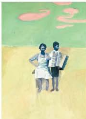
● The Music Boy, Green , 2013, 150 x 130 cm.