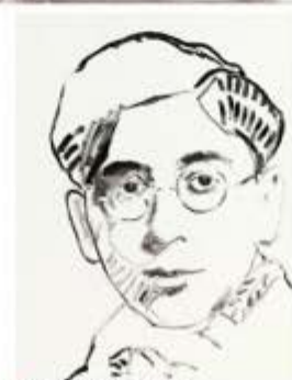
● Michel , 2011, 50 x 40 cm.

spelen. Aanzienlijk deed hij dwangarbeid in de steengroeven, maar toen het kamp over een veld in de buurt kwam, wasde hij zijn kans. Doordat zijn handen lapot waren van het zware werk, slaagde hij niet in zijn toegangsproef. Gelukkig kreeg hij lichter werk in de SS-kampen en wat later een tweede kans.